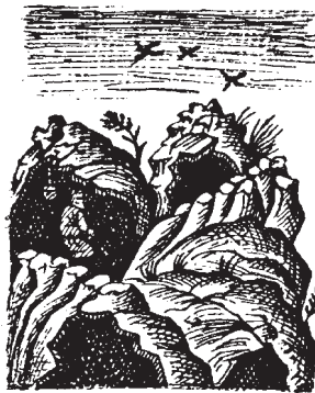
Ἀσκηταρῖα τῆς Κοινοβουλίας κατὰ τὸ Κιζιλ Τεμάκ κ.κ.