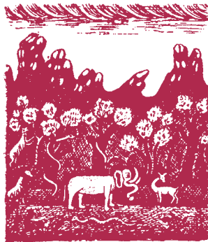
Ἐλέφας κι' ἄλλα ἀγέριμα διαφορετικὰ