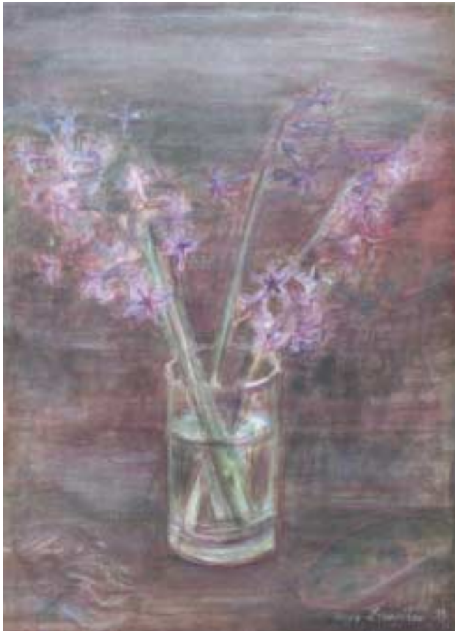
Όλγας Σταυρίδου Ζουμπούλια