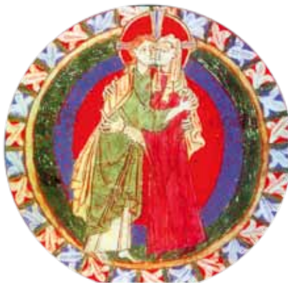
Ὁ Χριστὸς καὶ ἡ Ἐκκλησία, Alardus Bible 1097, Bibliothèque Valenciennes, France Εἰκόνα ἐξωφύλλου: «Ὁ ἐν Κανᾷ γάμος». Μωσαϊκὸ ἐξωτερικοῦ νάρθηκα (1315-1321) Κωνσταντινούπολη, Μονὴ Χώρας.

στον οὐρανὸ καὶ στὴ γῇ καὶ ὁ γάμος τους δὲν ἀφορᾷ μόνο τοὺς ἴδιους, ἀλλὰ ἀποτελεῖ ὑπόθεση ὁλόκληρης τῆς Ἐκκλησίας, ὁλόκληρου τοῦ Σώματος τοῦ Χριστοῦ. Γι' αὐτὸν ἀκριβῶς τὸν λόγο δὲν νοεῖται «ἰδιωτικὸς γάμος», ποὺ ἐξαίρετῇ ἔστω κι ἓναν πιστὸ ἀπὸ τῆ συμμετοχῆ του στὸ μυστήριο. Ὁ γάμος εἶναι λειτουργικὴ ἀκολουθία, ποὺ τελεῖται μὲ τὴν παρουσία τοῦ συνόλου «τοῦ λαοῦ τοῦ Θεοῦ». Γιὰ τοὺς χριστιανούς, ὁ λαὸς τοῦ Θεοῦ εἶναι ἡ ἅμεση οἰκογένειά τους, ἔχουν κοινὸ Πατέρα, τὸν Θεό, καὶ κοινὴ Μητέρα, τὴν Ἐκκλησία. Τὰ μυστήρια τῆς Ἐκκλησίας δὲν εἶναι προσωπικὴ ὑπόθεση τοῦ ἱερέα, ποὺ τελοῦνται γιὰ τοὺς πιστοὺς μὲ μαγικὲς, τελετουργικὲς πράξεις. Τὰ μυστήρια εἶναι «λειτουργικά», πράγμα ποὺ σημαίνει σύναξη τῶν πιστῶν καὶ ὄχι ἀπλὰ μιὰ τελετουργία. Ὁ ὀρθόδοξος γάμος εἶναι ὑπόθεση ὁλόκληρης τῆς σύναξης τῶν πιστῶν, στὴν ὁποία ὁ πρεσβύτερος, ὡς χειροτονημένος ἀντιπρόσωπος τῆς σύναξης, προεδρεῖ.